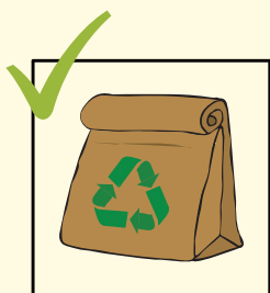
Sacchetti di carta